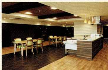
キッチン&ダイニング